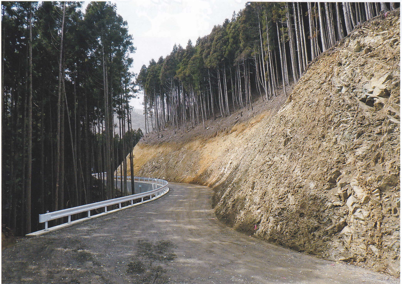
令和 5 年度民有林林道工事コンクール 農林水産大臣賞 (群馬県桐生市 梅田小平線 施工者：坂本建設(株))